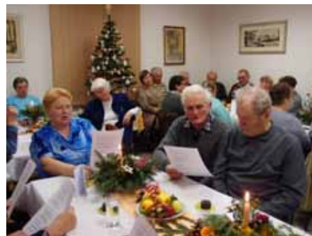
19. 12. vánoční posezení