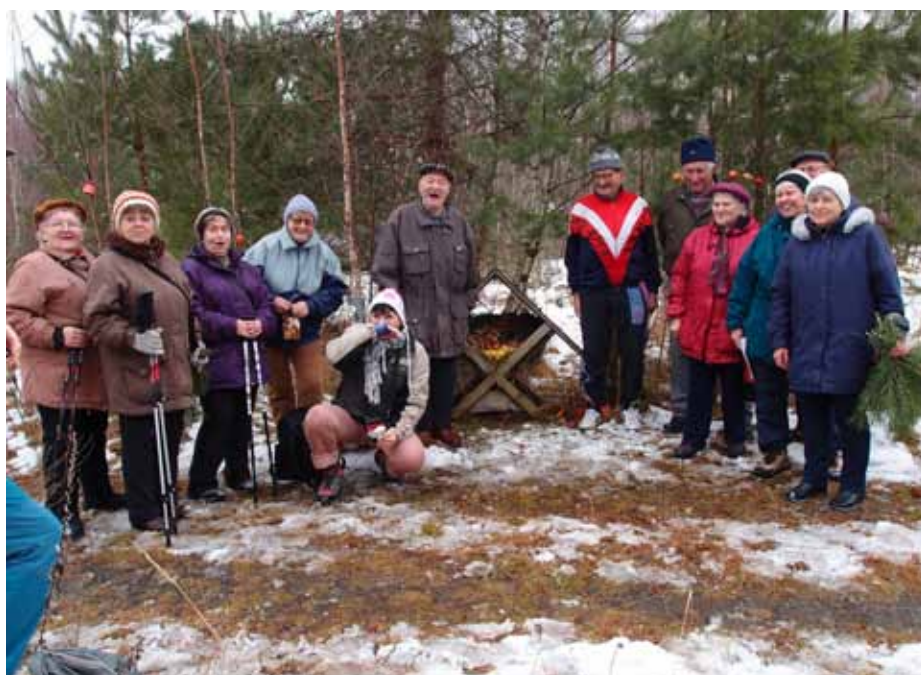
18. 12. nadílka v lese