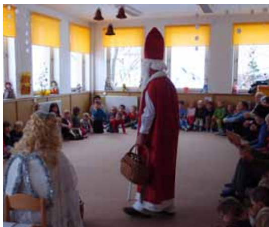
5. 12. Mikuláš v MŠ