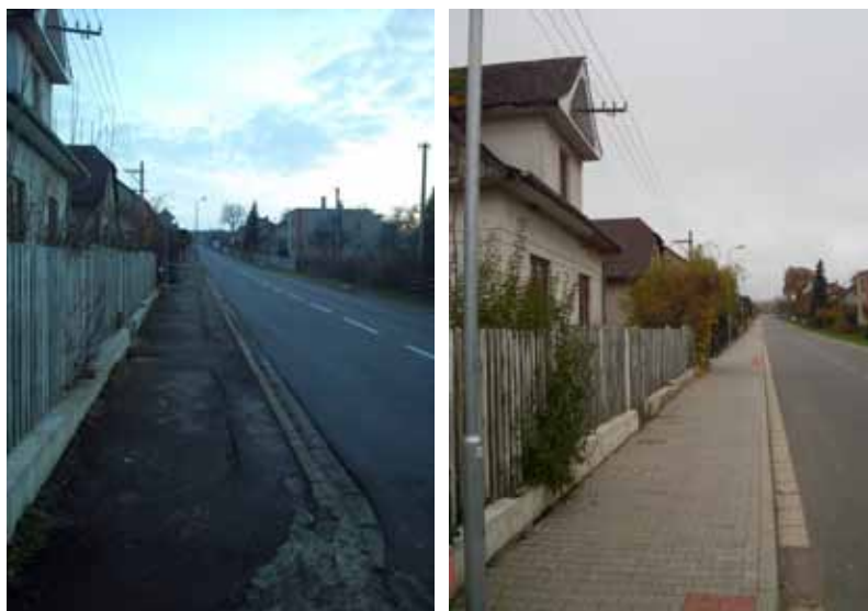
stav před a po realizaci