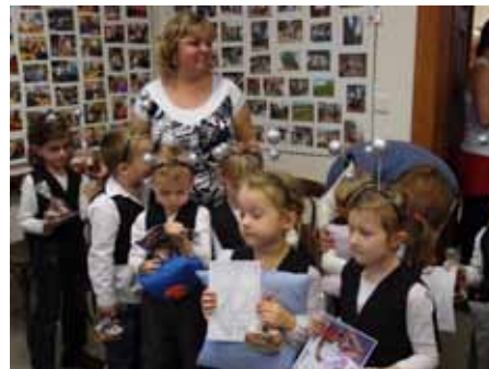
6. 12. Cvrčci v klubu