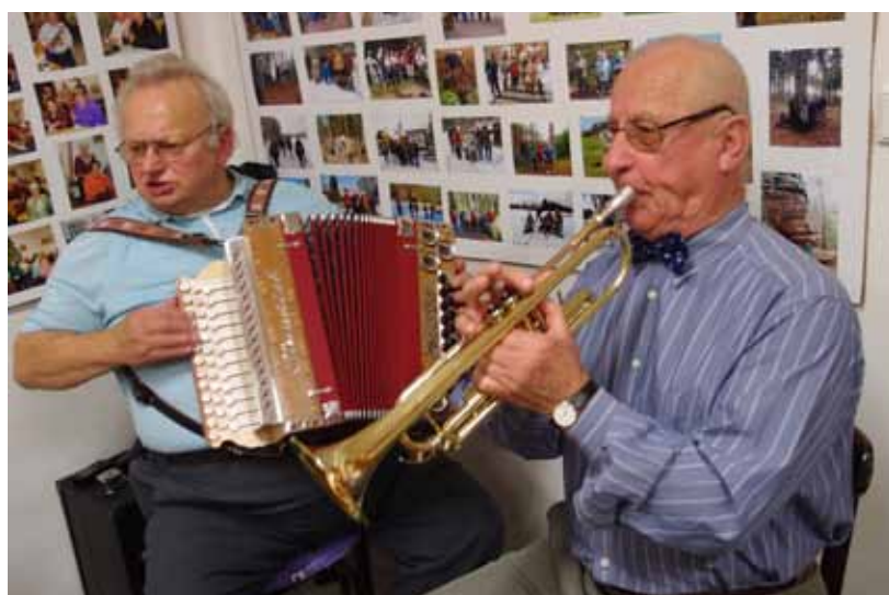
15. 11. Den mužů - Víte, že na 19. 11. připadá Den mužů? My to víme, a proto všechny ženy mužům popřály, podarovaly je hlavně slovně a pak jsme si společně zazpívali.