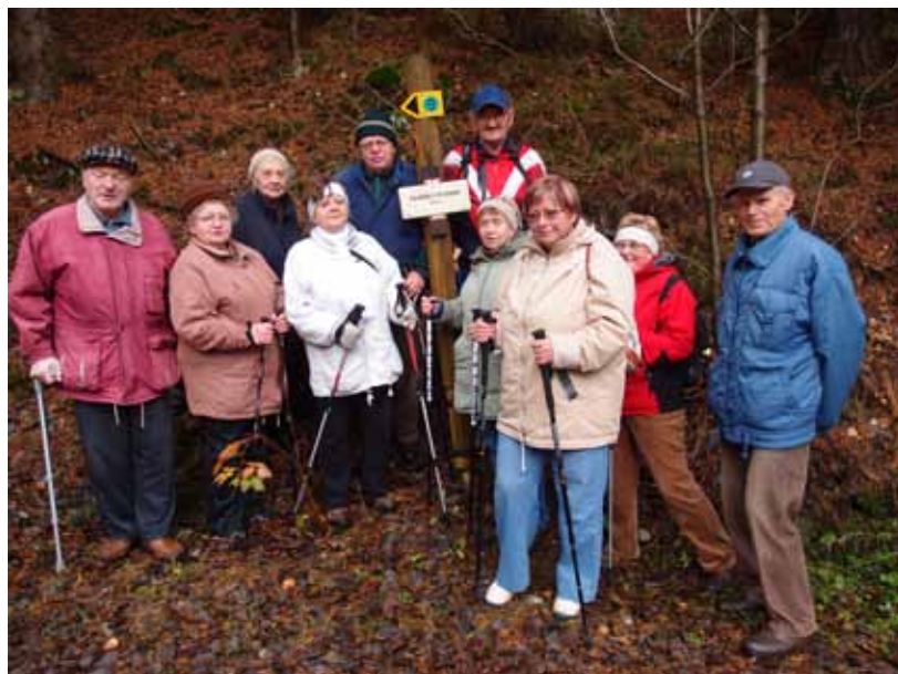
6. 11. Vycházka do Jarošova - Zdařilá vycházka pozdním podzimem vedla z Borku kolem Panských rybníků do Jarošova a zpět okolo Touloucovy rozhledny do Budislavi.