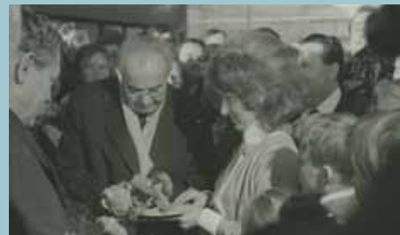
Foto: Generální tajemník ÚV KSČ Dr. Gustáv Husák při návštěvě cukrovaru v Hrochově Týnci (1972).