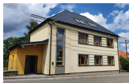
stav po realizaci