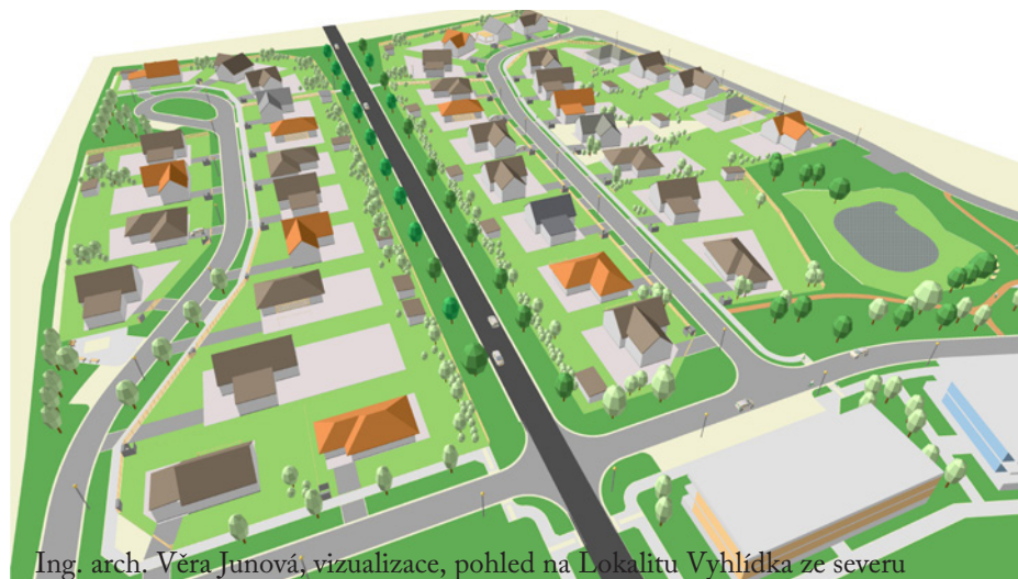
Ing. arch. Věra Junová, vizualizace, pohled na Lokalitu Vyhlička ze severu