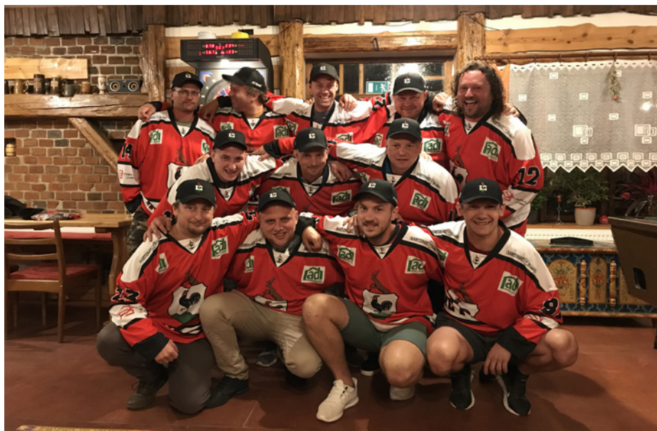
Tým HC Proseč