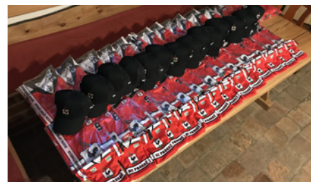
Nové dresy a týmové vybavení