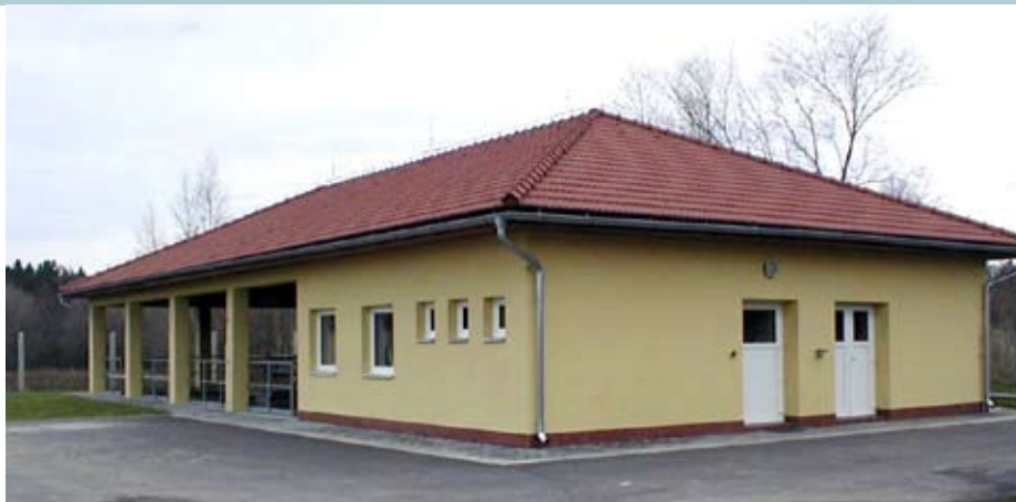
Čistička odpadních vod v Proseči

Platit stočné budou pouze občané místní části Proseč, Záboří a Podměstí,