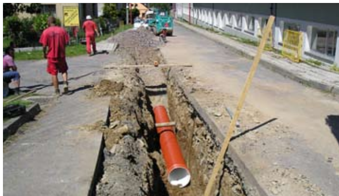
IV. etapa výstavby kanalizace v Proseči

Zrušením septiků, jímek na vyvážení a domovních ČOV odpadne majitelům nemovitostí povinnost tato zařízení řádně provozovat, pravidelně tato zařízení vyvážet a usazený kal – odpad z těchto zařízení prokazatelně likvidovat v souladu se Zákonem č. 185/2001 Sb., o odpadech. Současně se zbaví nemilého zápachu spojeného s provozem septiku nebo jímky a část pozemku, který byl trvale zablokovaný na septik nebo jímku bude moci být využit k jinému účelu.