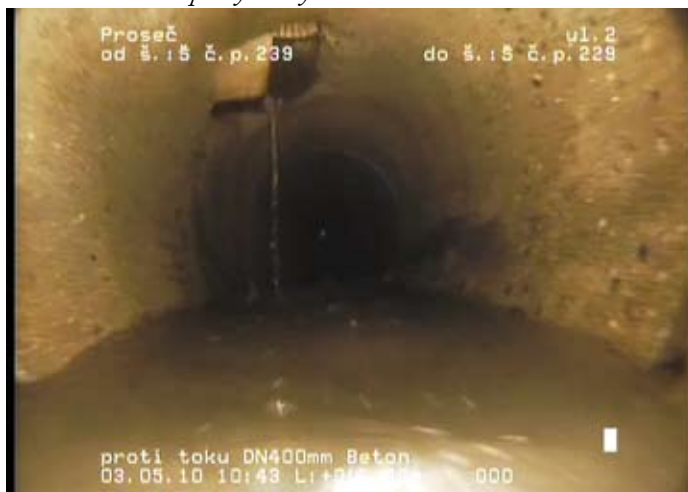
kamerový průzkum kanalizace v Proseči