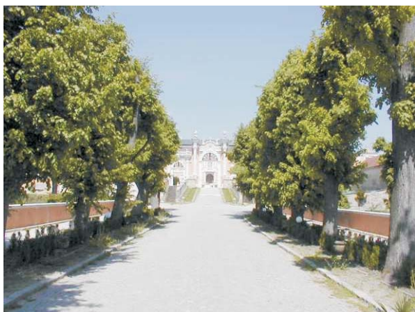
Lipová alej v Nových Hradech

Rozhodli jsme se pro třetí variantu, bohužel zatím to na základě zásahu ČIŽP (Česká inspekce životního prostředí) vypadá, že budeme nuceni stromy uříznout až u země (4. varianta), protože nám hrozí pokuta v horní výši a to především z důvodu již zahájeného šetření a tím pádem úmyslného porušení zákona. K tomu si dovoluji poznamenat, že si myslím, že zákon není ideální (ořez stromů je možný pouze v takové míře, že může být ořezána pouze třetina koruny a kráceny větve do průměru 10 cm) a místo prodloužení života stromům bude docházet k jejich kácení. Pro náš úřad to bude bohužel jeden z dalších argumentů na vahách pro povolení kácení. V našem případě, pokud bychom stromy