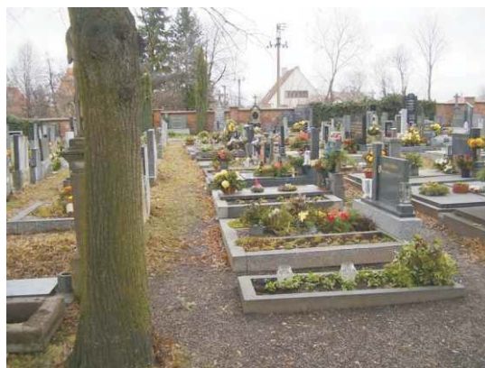
Lípy na prosečském hřbitově

2. Prořezat lípy ob jednu, aby měly více prostoru. Toto v sobě neslo nebezpečí vyšší pravděpodobnosti vývratu, protože těžiště náporu větru není možné prořezem z důvodu výšky koruny snížit.