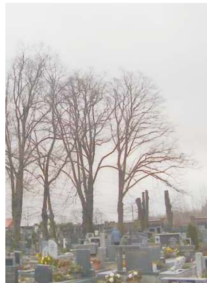
Lípy na prosečském hřbitově